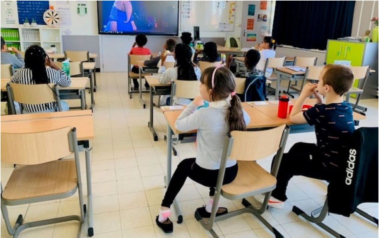
De nieuwste technologie, interactieve lessen met clevertouch borden