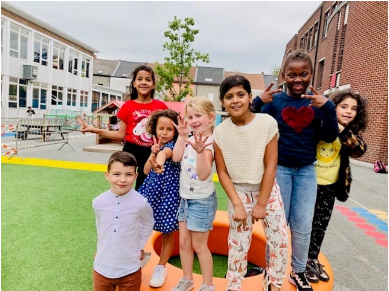
Speelplaats lagere school