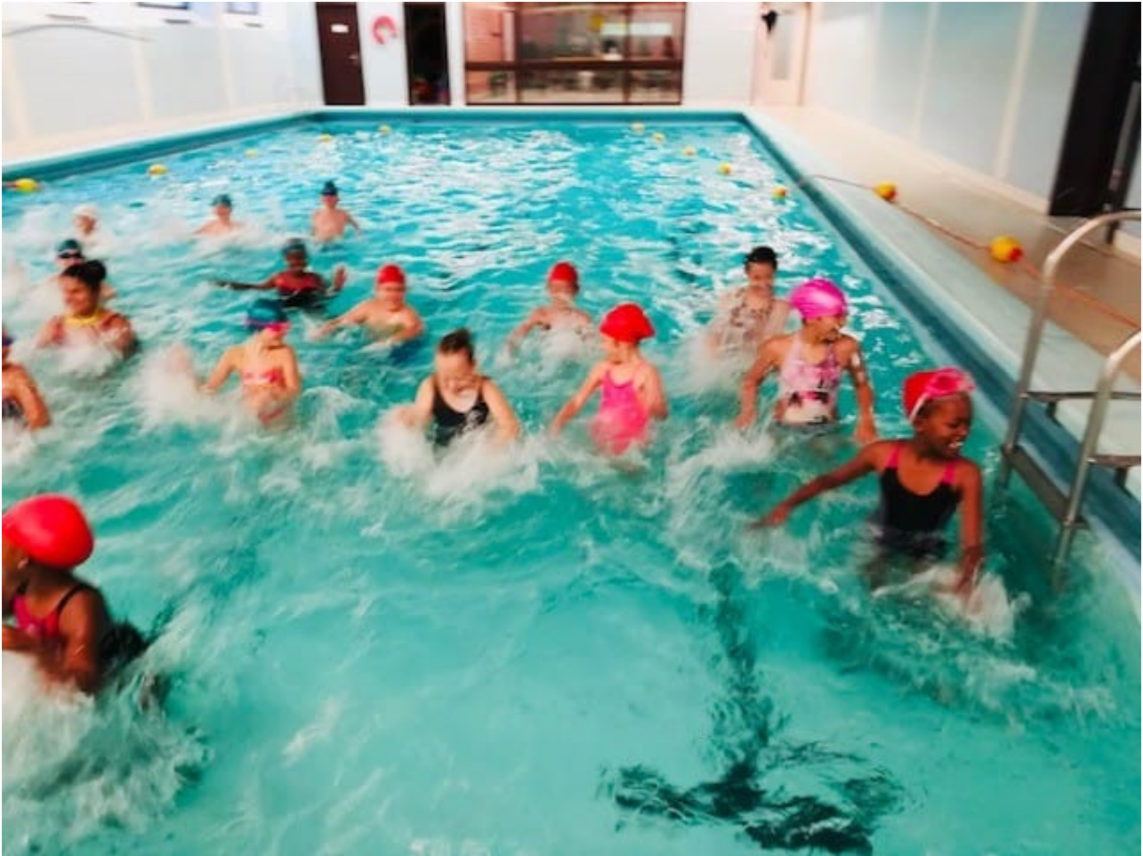
Zwembad lagere school