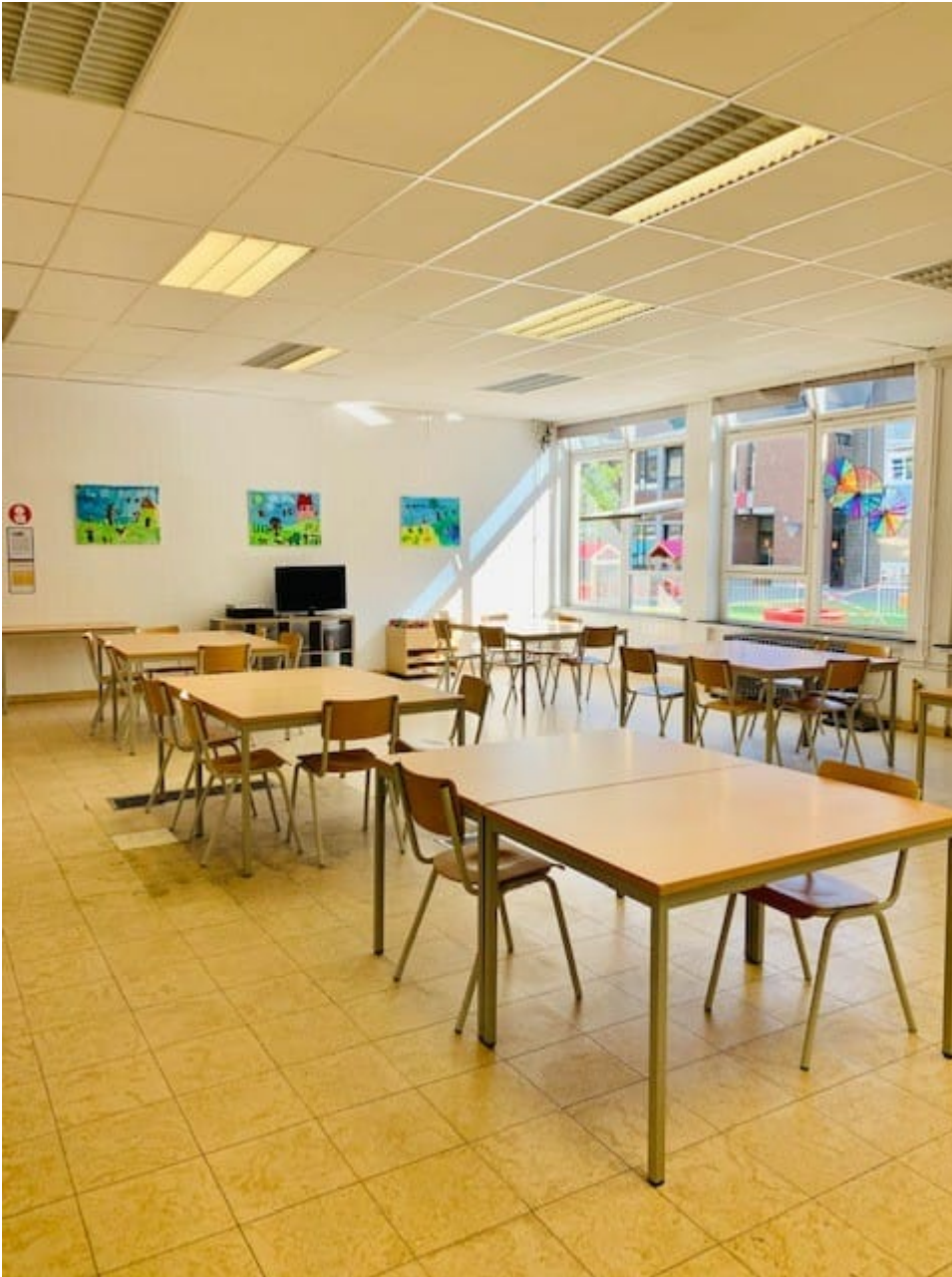
Opvangruimte leerlingen lagere school