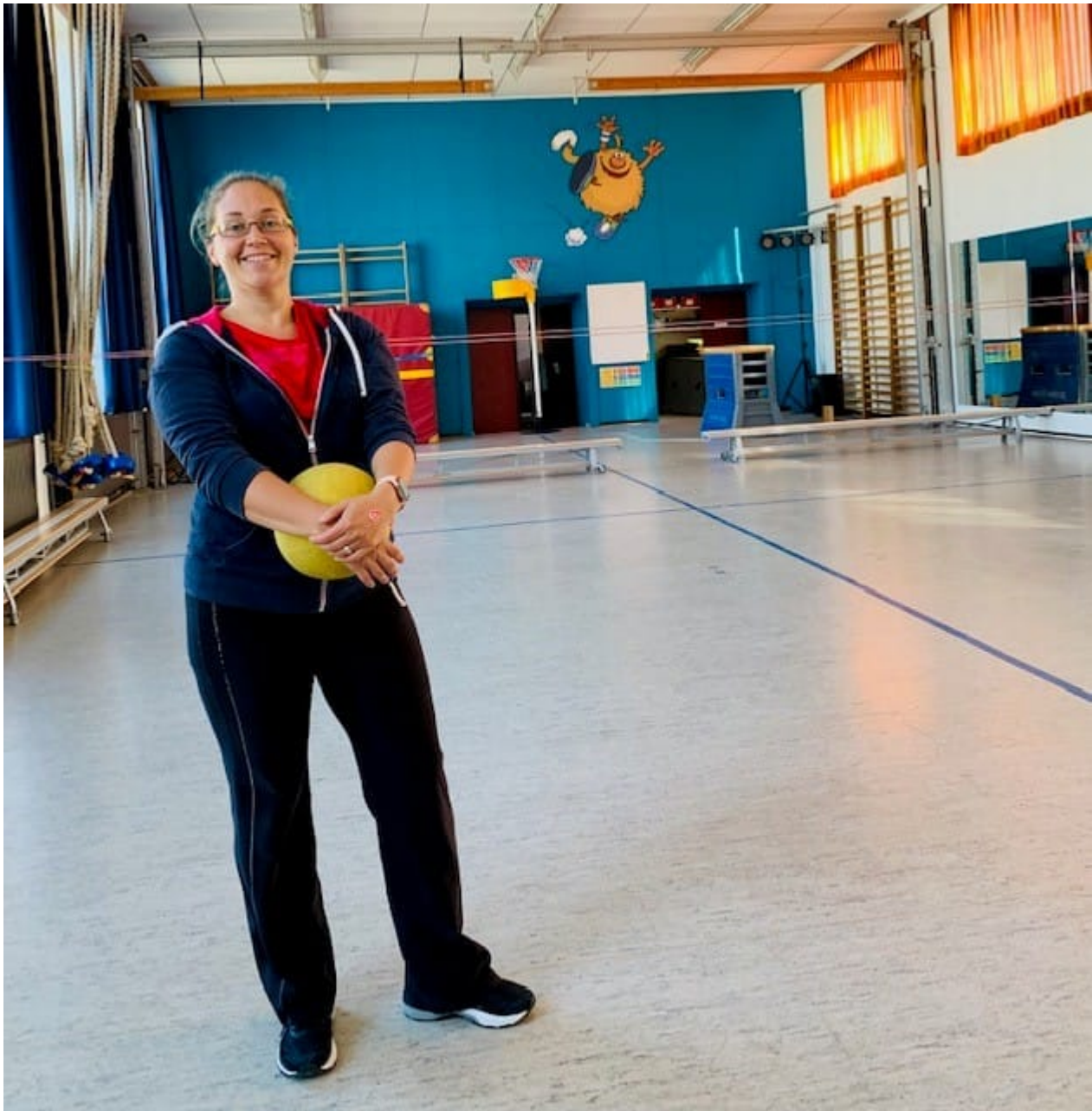
Sportzaal lagere school