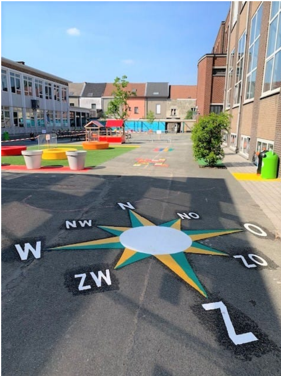
Speelplaats lagere school