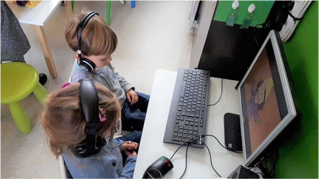
Luisteren naar een digitaal prentenboek