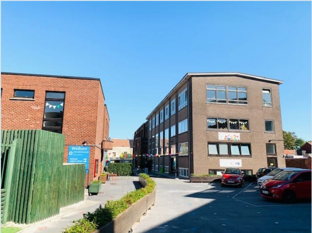
Ingang lagere school en onthaal campus